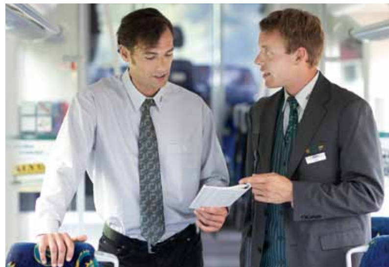
Starkes Team: Triebfahrzeugführer und Servicemitarbeiter besprechen Besonderheiten während der Schicht.

Ja. Neben den Vorkehrungen im Tunnel, wie beleuchtete Wege und gekennzeichnete Notausgänge, bildet die ODEG alle Zugpersonale anhand eines Selbstrettungskonzeptes aus. Geschult wird dabei u. a. das Räumen eines Zuges im Tunnel und wie Fahrgäste an einen sicheren Ort gebracht werden. Damit die Verständigung klappt, sind alle Züge mit einem Megafon ausgestattet. Außerdem gibt es ein Konzept, wie ein liegengebliebener Zug aus dem Tunnel herausgeschoben werden kann.