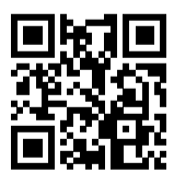
Ersatzhaltestelle Richtung Bergen auf Rügen