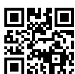
Ersatzhaltestelle Richtung Berlin

* Fahrradmitnahme im Schienenersatzverkehr nur begrenzt möglich. Im QR Code sind die Koordinaten der Ersatzhaltestelle hinterlegt.